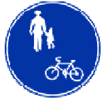
自転車歩道通行可