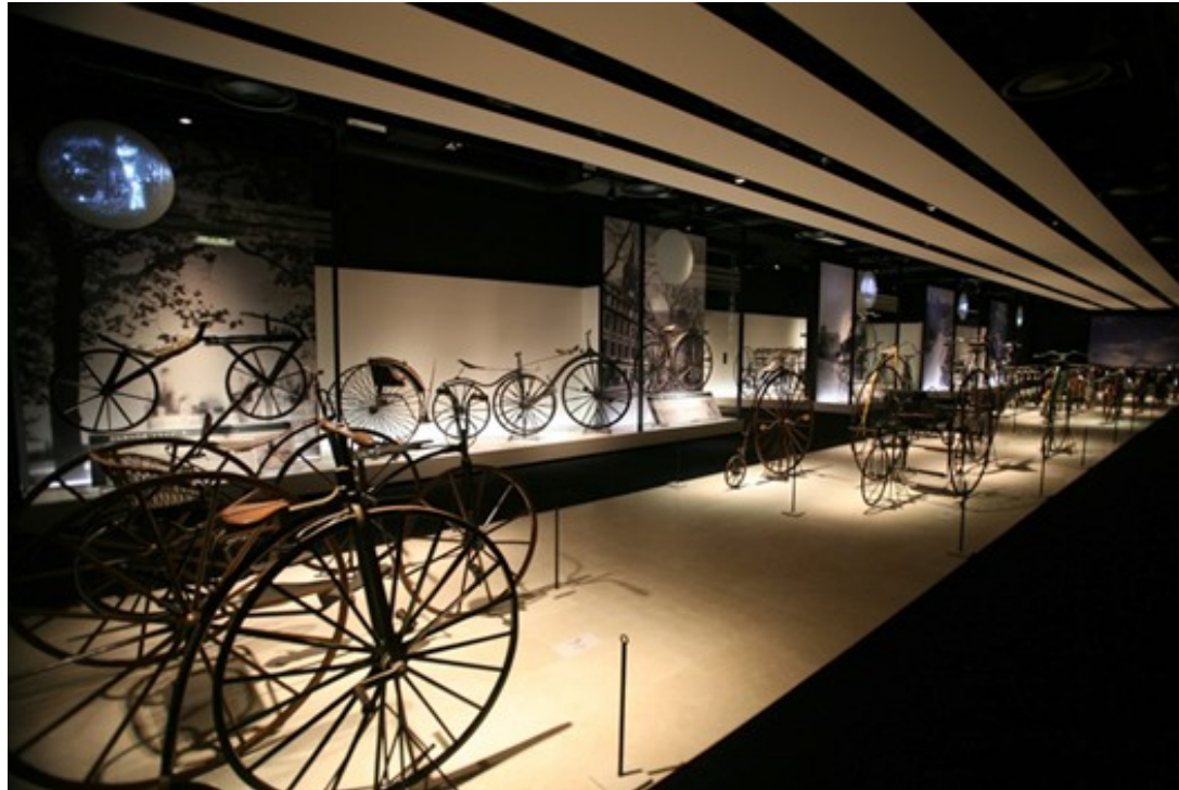
시마노 자전거 개발 센터 (Shimano cycle development center)